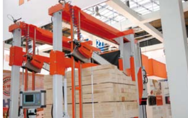
Zainteresowanie wzbudzała przygotowana dla francuskiego producenta palet wielopiętowa, a przez to bardzo wydajna, stacja do kapowania pakietów HOLTEC quattro.