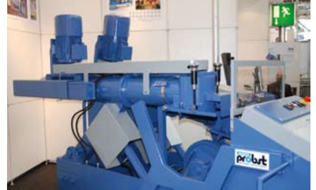
W Hanowerze nie mogło zabraknąć producenta maszyn do obróbki drewna cienkiego i średniowymiarowego, a także do programu ogrodowego – firmy Wema Probst.

kładów stolarskich i firm przerabiających niewielkie ilości drewna, zostały nazwane V-Basic. Większe suszarnie próżniowe, przeznaczone dla firm posiadających własne kotłownie, to obecnie klasa V-Comfort. Natomiast grupa urządzeń wyposażonych w zespół pompy ciepła otrzymała nazwę V-Premium. Te ostatnie wymagają jedynie podłączenia do prądu, a ich atutem jest niewielkie zużycie energii, dlatego właśnie ten model cieszył się największym zainteresowaniem zwiedzających.